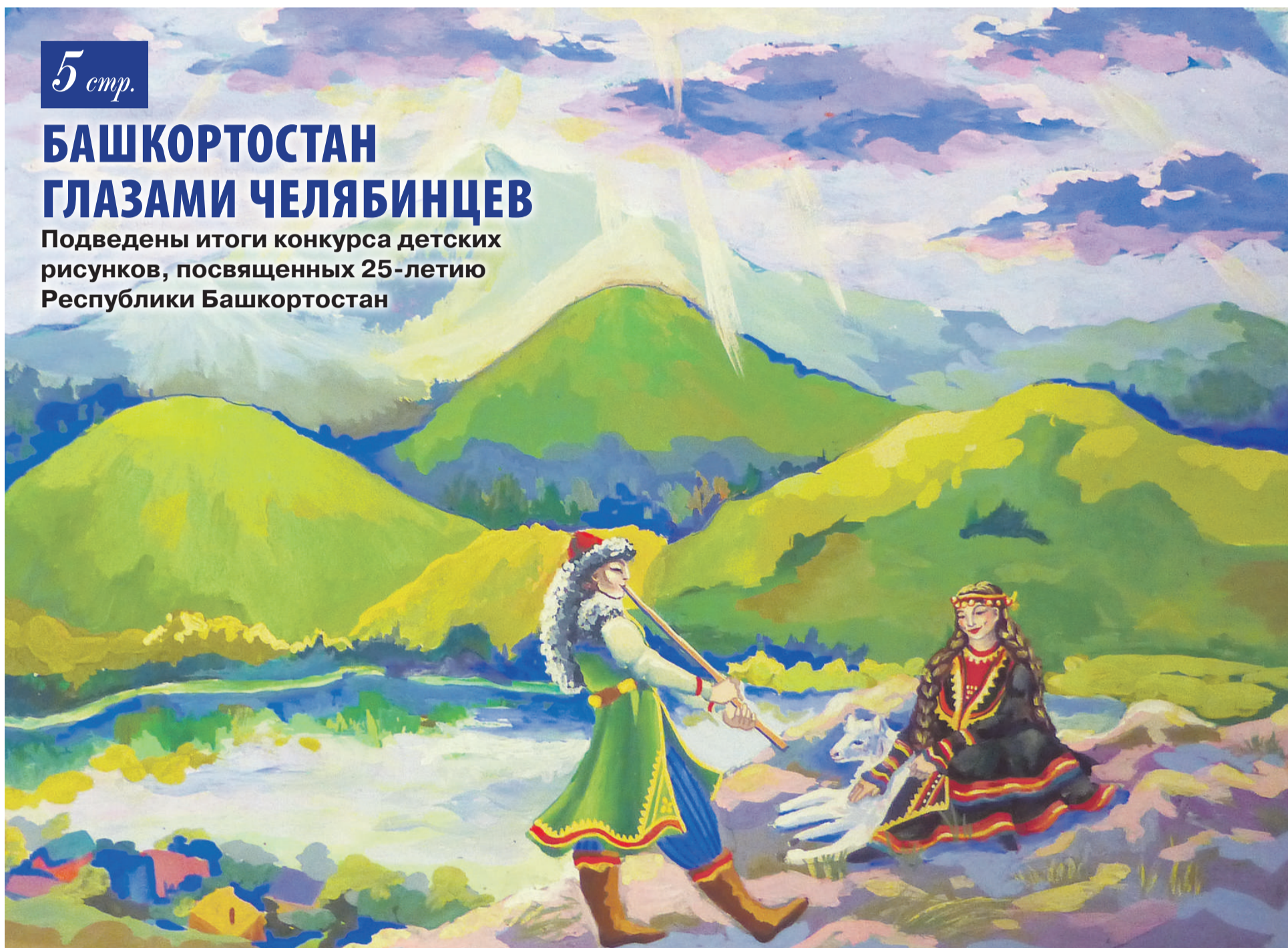
Рис. Регины Насырьяновой, МБУДО «ДШИ» № 1 г. Магнитогорска

Подведены итоги конкурса детских рисунков, посвященных 25-летию Республики Башкортостан