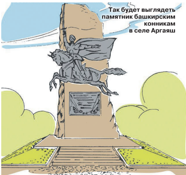
Так будет выглядеть памятник башкирским конникам в селе Аргаяш

Страна выстояла в этой жестокой войне, благодаря солидарности всех народов Советского Союза. А в Челябинске праздник Победы завершился грандиозным салютом.