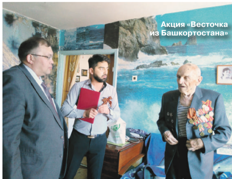
Акция «Весточка из Башкортостана»

Достойный вклад в победу внесла и наша Республика. На сегодняшний день только в Челябинске проживает около 10 ветера-