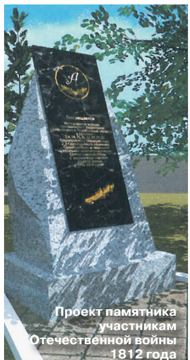
Проект памятника участникам Отечественной войны 1812 года