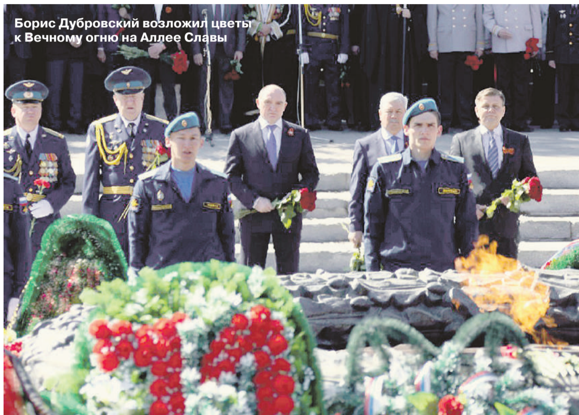
Борис Дубровский возложил цветы к Вечному огню на Аллее Славы

В Челябинской области прошли мероприятия, посвященные 71-й годовщине Победы в Великой Отечественной войне 1941 – 1945 гг.