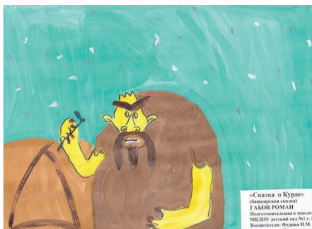
«Сказка о Куряе» (Башкирская сказка) ГАБОВ РОМАН Подготовительная и школа МКОУ «детский сад №1 г.г. Высоты Ишимово» Фельда И.М.