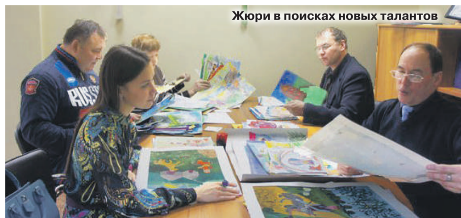
Жюри в поисках новых талантов

шусь к подобным мероприятиям, которые направлены на сохранение и развитие истории, языка народов России. В этом конкурсе участвовали дети разных национальностей. Подкупило, что дети и педагоги основательно готовились к конкурсу. Тщательно ознакомились с условиями и изучали национальную культуру, сказки.