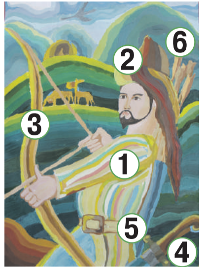
Рисунок Айгуль Шаяхметовой, МБУ ДО «ДШИ», г. Благовещенск, Республика Башкортостан