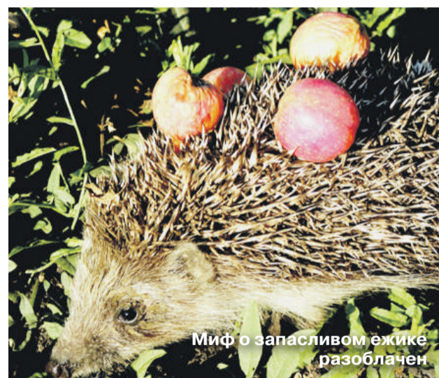
Миф о запасливом ежике разоблачен

Общение с природой дает мне силы, успокаивает. Я встаю рано. В 6 часов утра уже на ногах. Днем для восстановления организма требуется всего лишь 15 минут отдыха. При этом желательно надевать маски для сна, так как на 80% человек устает через зрительное восприятие.