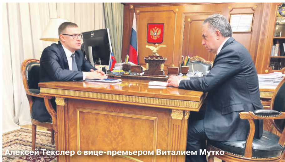
Алексей Текслер с вице-премьером Виталием Мутко

7 мая 2018 года Президент России В. В. Путин подписал указ «О национальных целях и стратегических задачах развития Российской Федерации на период до 2024 года», устанавливающий и утверждающий национальные проекты России. На Южном Урале активно идет реализация этих проектов.