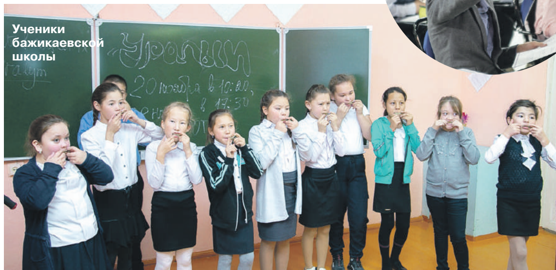
Ученики бажикаевской школы

Новые национальные проекты приняты в России в 2018 году и разработаны по трём направлениям: «Человеческий капитал», «Комфортная среда для жизни» и «Экономический рост».