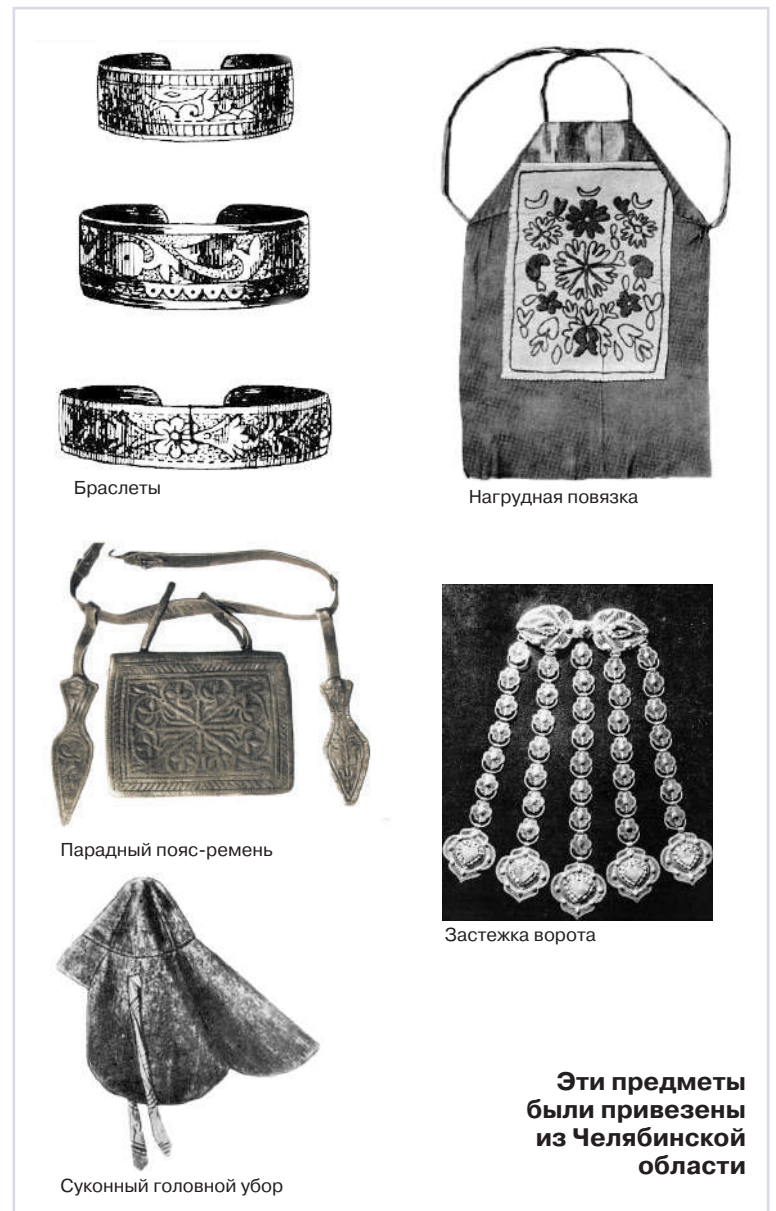
Эти предметы были привезены из Челябинской области

В сравнительно небольшой по размерам коллекции Месароша действительно представлены многие стороны материальной культуры башкир. Довольно разнообразен круг предметов, связанных с занятиями башкир охотой, рыболовством и собирательством. Здесь не-