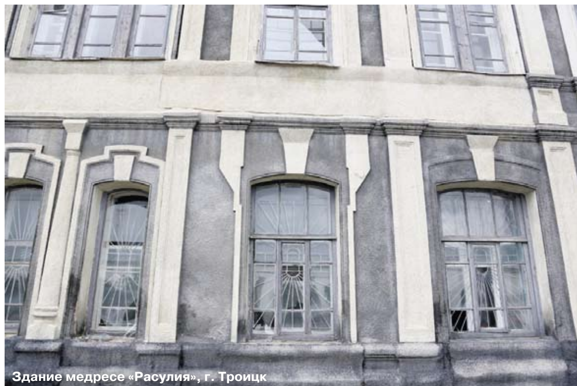
Здание медресе «Расулия», г. Троицк

Зайнулла Расулев является духовным лидером башкир всего мира. У коренных жителей Урала – башкир особое отношение к шейху. Именно на территории нашей области покоится великий ишан. На Южном Урале он сумел открыть учебное заведение, благодаря которому выросла целая плеяда ученых, политиков, художников, писателей, инженеров из башкир. В нашем регионе проживают потомки ишана и продолжают его дело. В селе Редутово Чесменского района родственники Зайнуллы Расулева возвели мечеть. И мы, челябинцы, с гордостью считаем его своим земляком, духовным лидером!