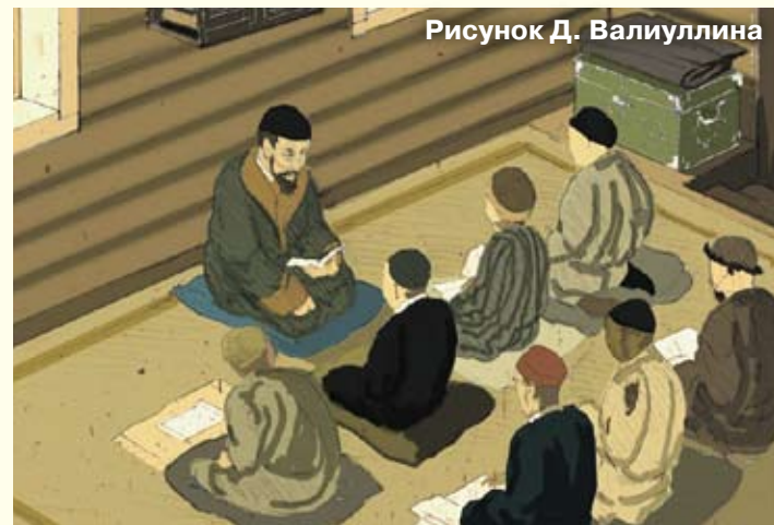
Рисунок Д. Валиуллина

Умер 2 февраля 1917 года. Покоится на старинном мусульманском кладбище г. Троицка Челябинской области.