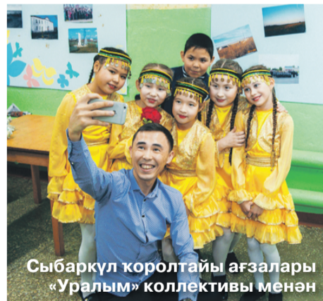
Сыбаркүл королтайы ағзалары «Уралым» коллективы менән

Үзгәртеү заманында кайһы бер ата-әсәләр зә балаларын милли телдә генә укыһалар, зур укыу йорттарына керә алмаһтар тигән карашта булып киттеләр, был бөтөнләй дәрәс түгел. Бына Колой ауылы урта мәктәбен милли телдә укып тамамлаған беренсе сығарылыш укыусыларының барыһы ла юғары белем алып сықтылар.