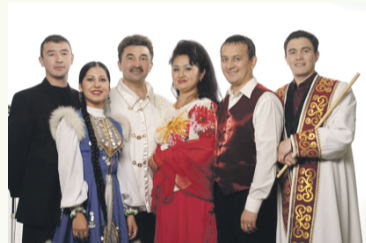
Группа «Далан» Челябинск, 7 марта в 18:00, ул. 50-летия ВЛКСМ, 16, ДЦ «Импульс».

25 февраля Челябинск, театр ЧТЗ, пр. Ленина, 10, в 19:00; 26 февраля с. Аргаяш, РДК, в 18:00; 27 февраля Миасс, ДК Автомобилестроителей, в 18:30; 5 марта Магнитогорск, театр оперы и балета, ул. Ленина, 16, в 19:00. Справки по тел. 8-917-436-21-32. Детям до 6 лет бесплатно.