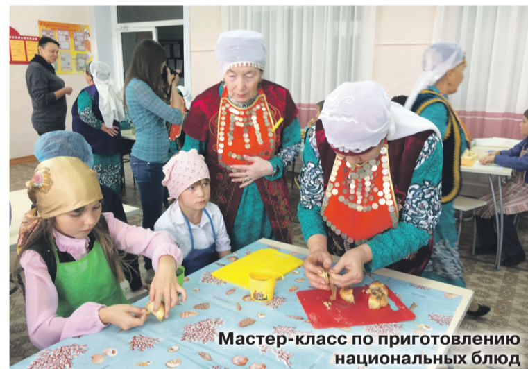
Мастер-класс по приготовлению национальных блюд