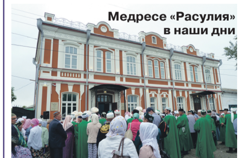
Медресе «Расулия» в наши дни