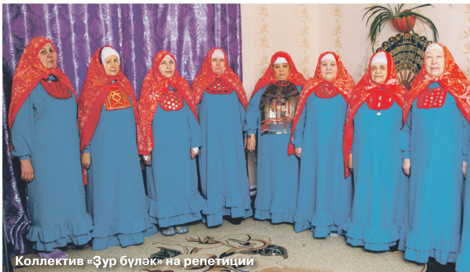
Коллектив «Зур булэк» на репетиции

Во время репетиции наша съемочная группа записала живое исполнение мунаджатов под аккомпанемент кубыза. В последнее время сохранению этого древнего жанра уделяется большое внимание. Традиционным стало проведение конкурса мунаджатов на Расулевских чтениях и других фестивалях народного творчества.