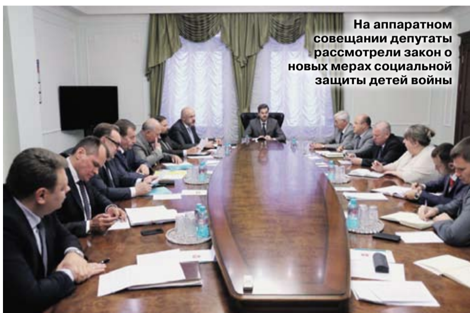
На аппаратном совещании депутаты рассмотрели закон о новых мерах социальной защиты детей войны

Отметим, в Челябинской области организация, которая объединяет детей погибших защитников Отечества, насчитывает около 40 тысяч человек, они являются членами региональной общественной организации «Память сердца», которая была создана в 2000 году.