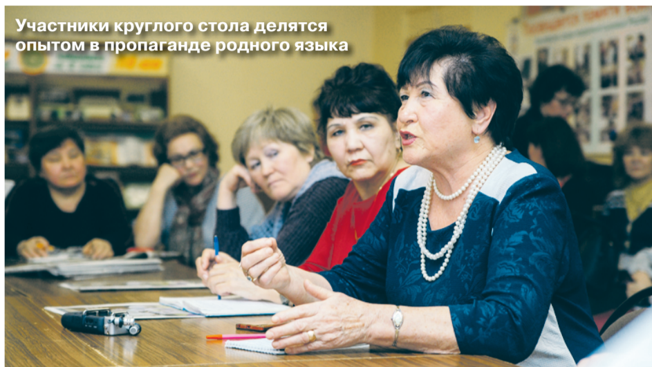
Участники круглого стола делятся опытом в пропаганде родного языка

Последующие выступающие с тревогой говорили о том, в каком состоянии находится преподавание