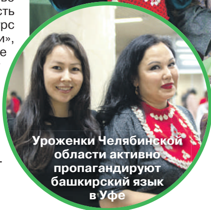
Уроженки Челябинской области активно пропагандируют башкирский язык в Уфе