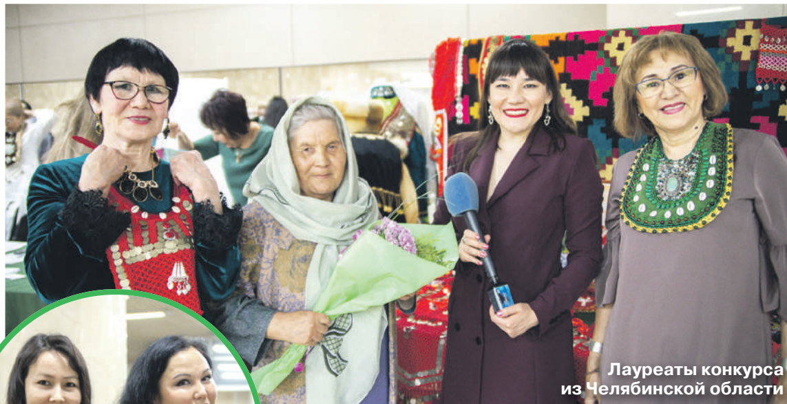
Лауреаты конкурса из Челябинской области