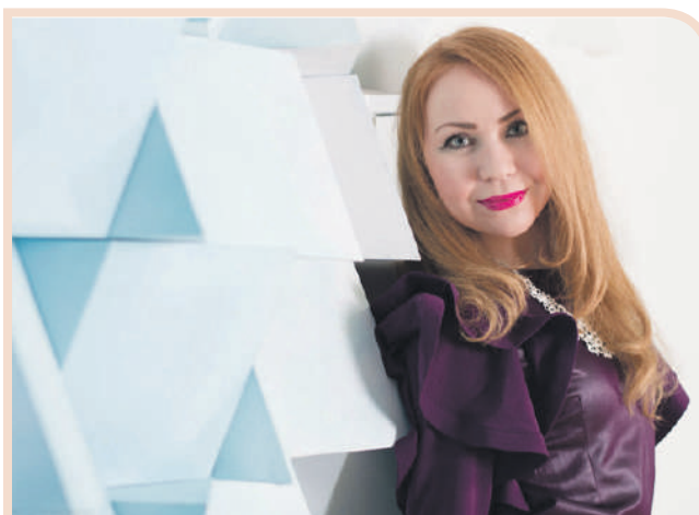
Дипломатия нужна во всех сферах