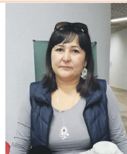
Сердце отдаю ребенку

Национальные украшения можно заказать по телефону +7-950-741-89-59.