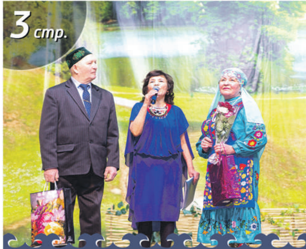
Башкиры Верхнего Уфалея