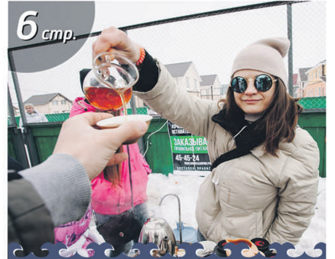
Әйзә, сәй эсергә!