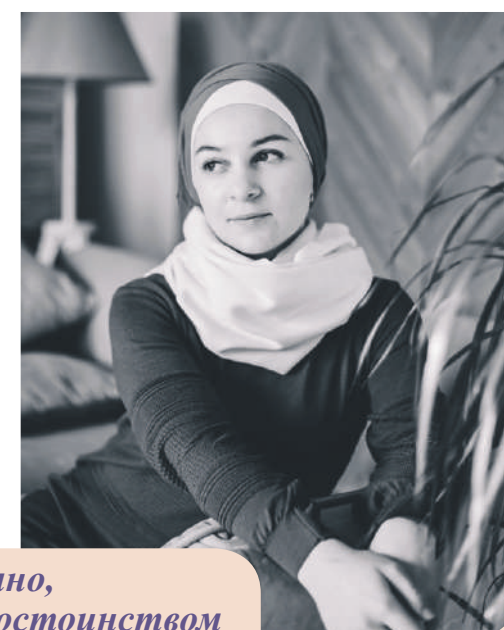
Скромно, но с достоинством