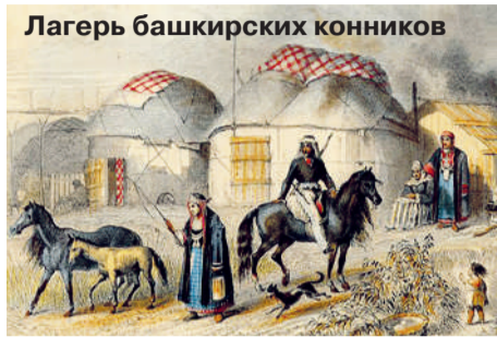
Лагерь башкирских конников