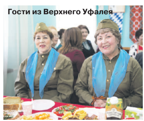
Гости из Верхнего Уфалея

В рамках мероприятия было подписано соглашение между Башкирским народным центром и Центром народного Единства. В документе говорится о взаимопомощи в проведении культурно-массовых мероприятий на башкирском языке.