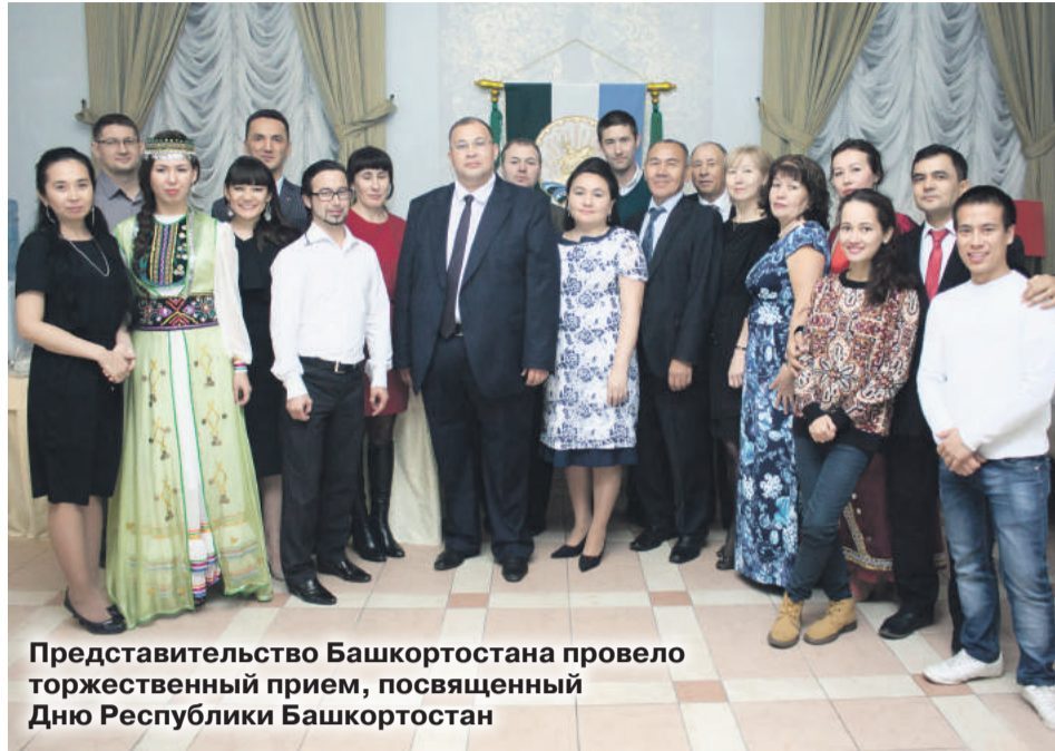
Представительство Башкортостана провело торжественный прием, посвященный Дню Республики Башкортостан

На приеме гости проявили живой интерес к темпам развития экономики республики. Башкирские товаропроизводители в регионе завоевали доверие покупателей и партнеров своей