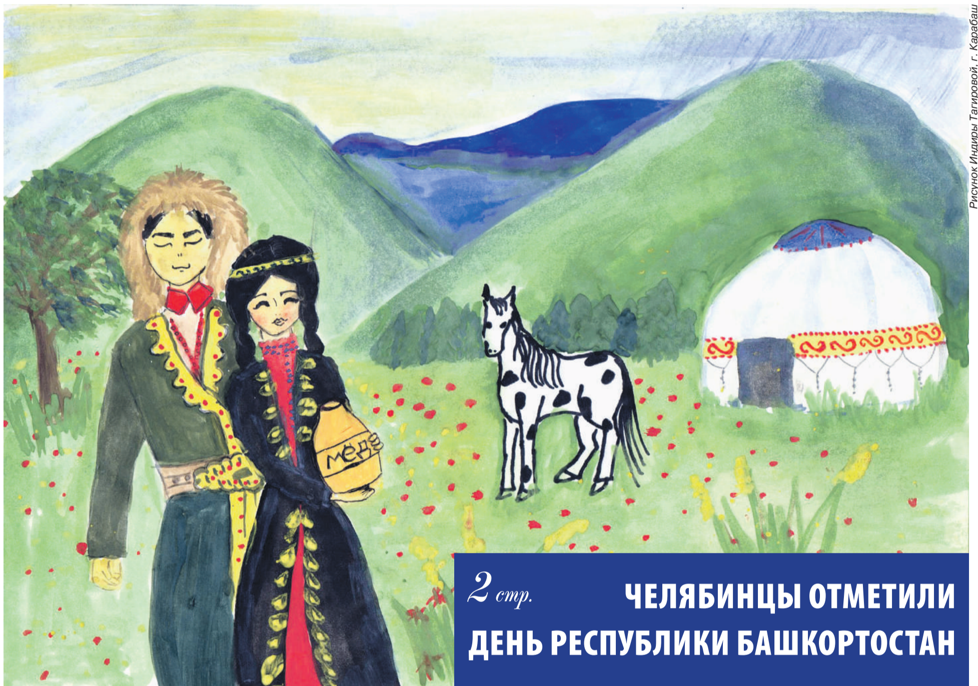
Рисунок Индиры Тагировой, г. Карабаш