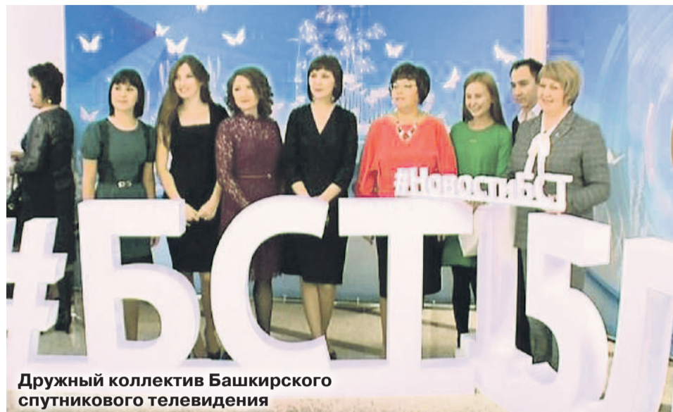
Дружный коллектив Башкирского спутникового телевидения