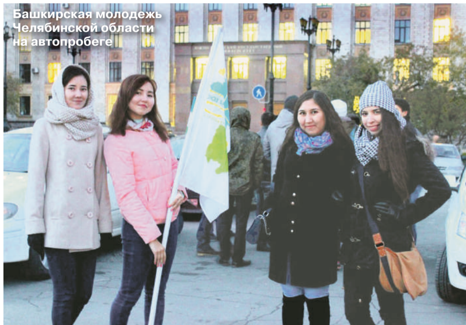
Башкирская молодежь Челябинской области на автопробеге

качественной и экологической продукцией. Бренды республики: башкирский мед, оздоровительные комплексы не раз были упомянуты в выступлениях присутствующих. Звезды башкирской эстрады Челябинска организовали концерт. Национальные песни, мелодия курая придали торжеству праздничную атмосферу.