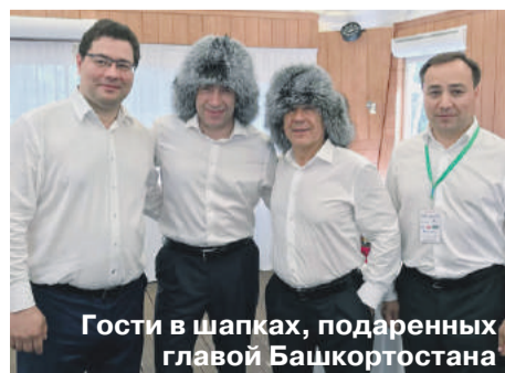
Гости в шапках, подаренных главой Башкортостана

Активное участие в проведении Сабантуя приняли Башкирская национально-культурная автономия Свердловской области, региональный курултай, Башкирский народный центр, ансамбль «Ядкар», самодеятельные артисты из Верхнего Уфалея. Они выставили 5 юрт, создав самобытный колорит, встретив почетных гостей национальными блюдами и веселыми песнями.