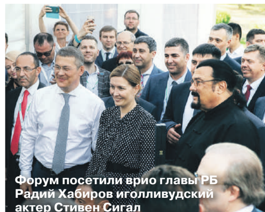
Форум посетили врио главы РБ Радий Хабиров и голливудский актер Стивен Сигал

Радий Хабиров, врио Главы Башкирии: «Цель этого форума — сделать так, чтобы экономика не только Сибая, но и целого ряда родных и близких нам районов Зауралья, задышала, заработала. Чтобы мы открыли все наши возможности для того, чтобы сюда приходили инвесторы, появлялись рабочие места и, соответственно, социальные объекты. Чтобы наши дети могли ходить во всевозможные садики, школы, физкультурно-оздоровительные комплексы. И чтобы люди на улицах улыбались».