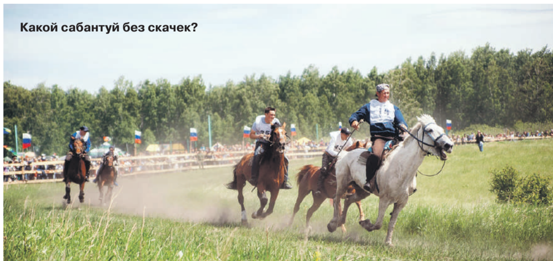
Какой сабантуй без скачек?