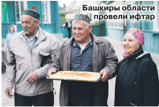
Башкиры области провели ифтар

Пост в месяц Шавваль добровольный и является сунной пророка Мухаммада (мир ему), но держащему его записываются несменные награды. В хадисе сказано: «Кто постился в месяц Рамадан, а затем держал пост шесть дней в месяц Шавваль, тому Господь определил вознаграждение, равное зачисляемому Им за пост в течение века».