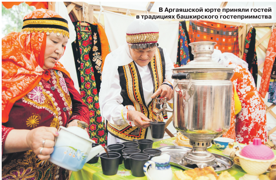
В Аргаяшской юрте приняли гостей в традициях башкирского гостеприимства

В городском саду имени А.С. Пушкина прошел XIV Уральский культурно-спор-