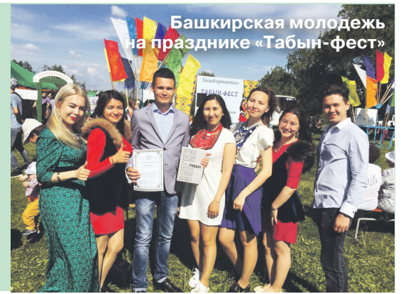
Башкирская молодежь на празднике «Табын-фест»

Ежегодно сородиче собираются в большой съезд рода. В этом году начали практиковать и молодежные форумы с участием делегаций со всей России.