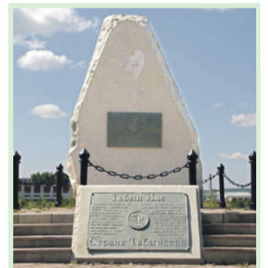
Ырыуым — Табын Кошом — Карағош Ағасым — Карағас Тамғам — Казаяк Ораным — Салауат

После длительного сопротивления нашествию монголо-татар башкиры решили признать вассальную зависимость от Чингисхана. Шежере свидетельствуют о том, что Майкы-бий с огромной свитой и богатыми дарами поехал в ставку Чингисхана, добровольно признав его власть, Майкы-бий спас башкир от участи населения Волжской Булгарии и Рязанского княжества, которые были жестоко разгромлены. Однако, оказавшись в составе централизованной империи Чингисхана, башкиры потеряли свою государственность. Впоследствии Табынское ханство распалось на 17 частей.