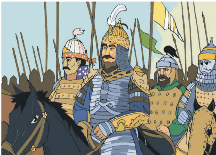
Рисунок Даяна Валиуллина

Выдающиеся историки Л.Н. Гумилёв, С.И. Руденко и другие показывают, что между Уралом и Алтаем племена табын, объединив 12 родов, создали мощное государство, куда входило и башкирское ханство, образовавшее мощное государство. В действительности, он представлял собой конфедерацию тюркоязычных государств. По словам академика Гайсы Хусаинова, в X–XII веках башкиры имели свою государственность, свои города, свою письменность. В результате объединения семи башкирских больших родов появилось мощное государство. Существует легенда о ханстве башкир, которое первым приняло на себя удар монголо-татар. По свидетельству венгерского монаха Юлиана, известно, завоеватели в течение 14 лет не могли покорить башкир. По расчетам великого евразийца Л.Гумилева ожесточенная война шла с 1220 по 1234 годы. Это потому, что на их пути встало сильное Табынское ханство во главе с Акташ-ханом. Согласно средневековым источникам, от Волги до Тобола протяну-