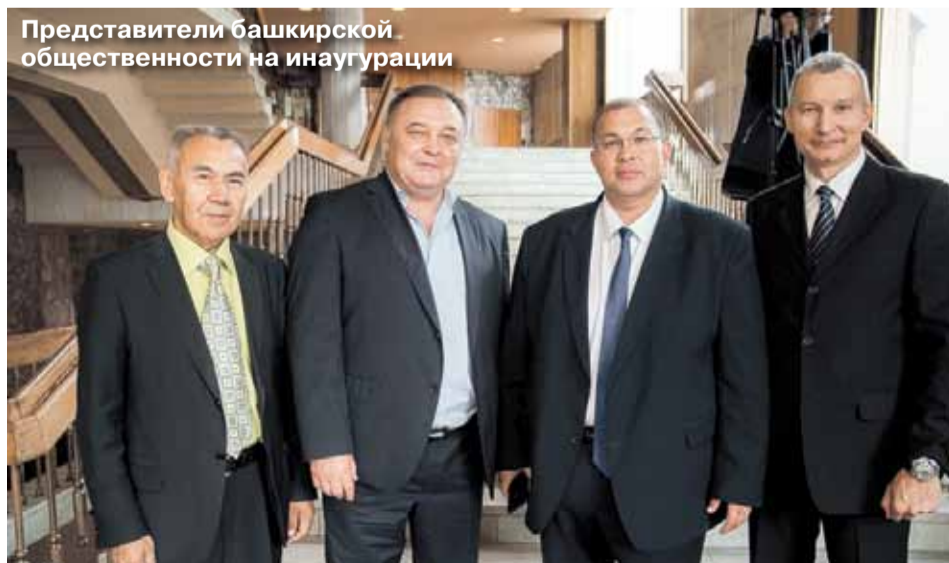
Представители башкирской общественности на инаугурации

Установка памятной доски позволит увековечить важный этап в истории Башкирской республики.