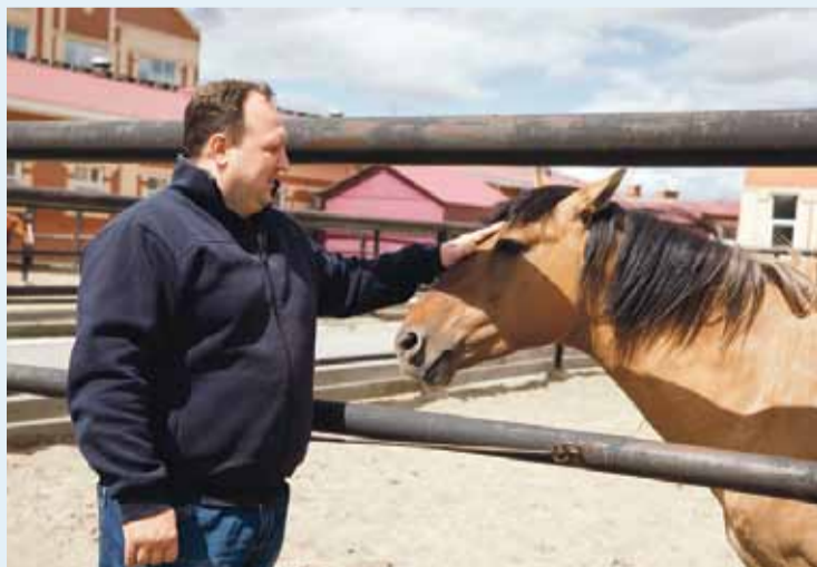
Силәбе өлкәһенә «Рифей» комплексында Бүләк исемлә ат йәшәй. Уны 2015 йылда Башкортостандан килтерәләр.

Бөгөнгө көндә Белорет калаһының Я.Хамматов исемендәгө башкорт гимназияһында йәш хәбәрселәр түңәрәгө алып бара.