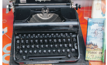
Кәтибә Кинйәбулатованың языу машинкаһы

Журнал «Башкортостан кызы» мотуг выписывать и граждане, проживающие за пределами Республики Башкортостан. Подписку осуществляет ФГУП «Почта России», в их каталогах издание находится под индексом П2719, П3365, 50606.