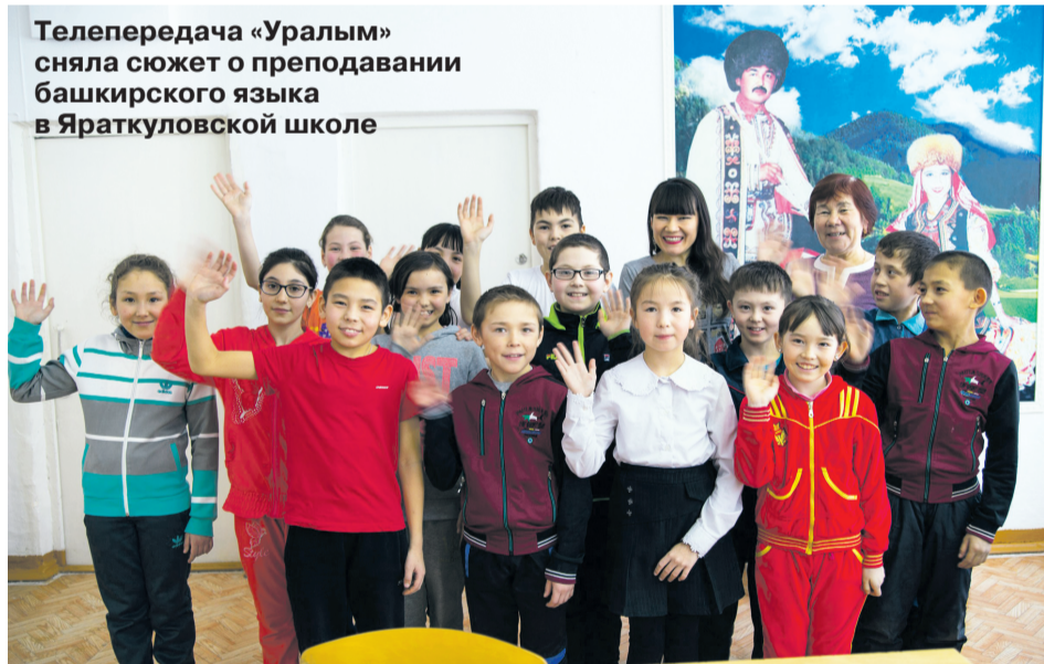
Телепередача «Уралым» сняла сюжет о преподавании башкирского языка в Яраткуловской школе

В Челябинской области проживает 162 513 башкир. Из них 89 079 городских жителей, 73 434 сельское население