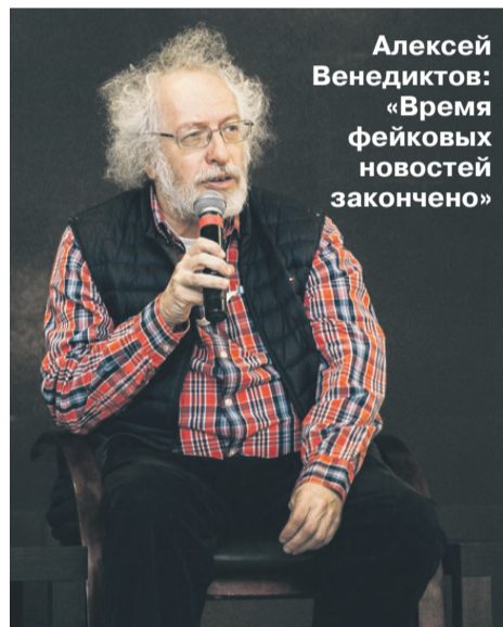
Алексей Венедиктов: «Время фейковых новостей закончено»

передать несколько цифровых. Это означает увеличение количества разнообразных каналов и программ для зрителей. Кроме того, переход на цифровое телевидение в перспективе позволит россиянам смотреть программы высокой четкости (HD-телевидение).