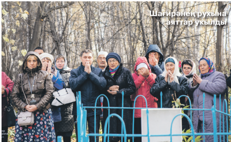
Шағирәнең рухына аяттар уҡылды

Силәбе өлкәһенә Арғаяш районында Кәтибә Кинйәбулатова исемендәге әҙәби премия булдырылды