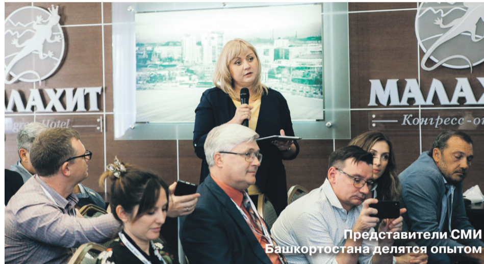
Представители СМИ Башкортостана делятся опытом

На форуме проходил круглый стол по вопросам перехода на цифровое эфирное телевидение, где заместитель Министра цифрового развития, связи и массовых коммуникаций Российской Федерации Алексей Волин отвечал на вопросы представителей региональных телеканалов.