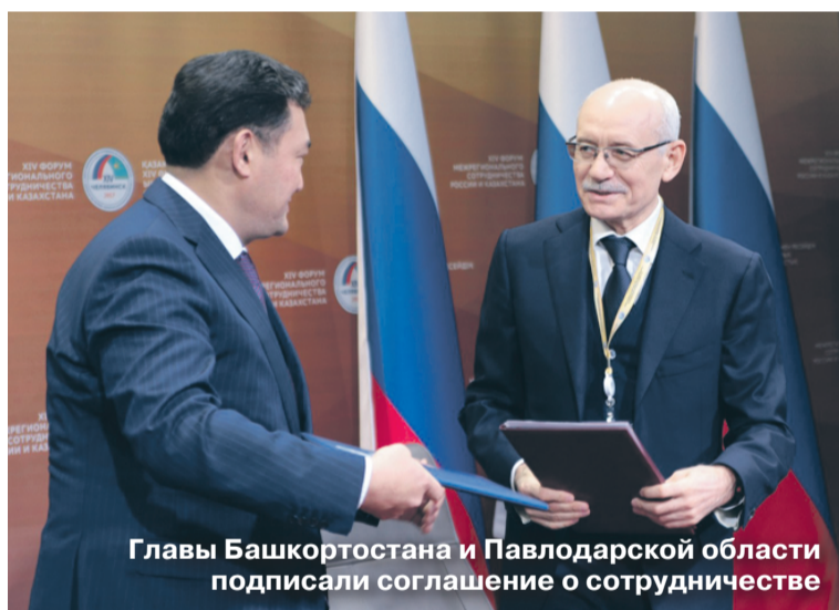
Главы Башкортостана и Павлодарской области подписали соглашение о сотрудничестве

Результаты визита Президента России Владимира Владимировича Путина в Челябинскую область и проведение XIV Форума межрегионального сотрудничества России и Казахстана принесут огромную, несомненную пользу для развития региона.