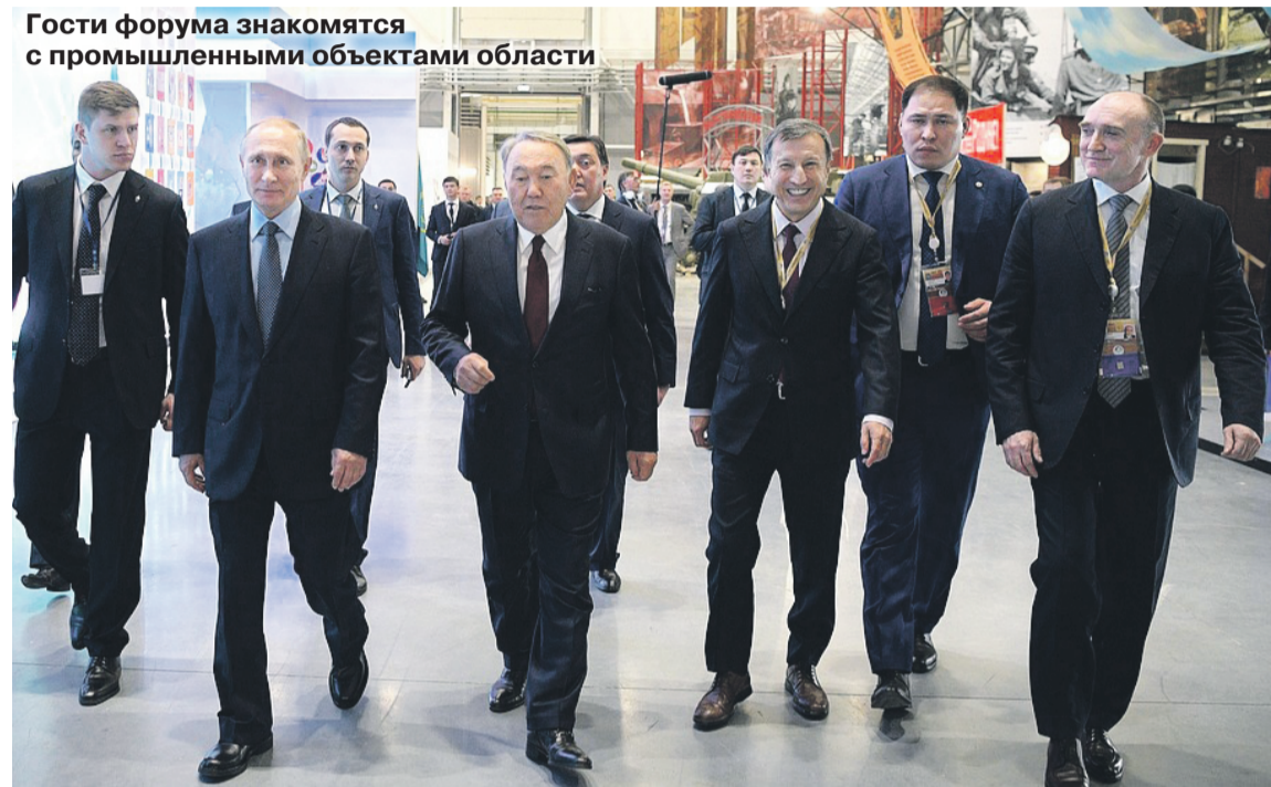
Гости форума знакомятся с промышленными объектами области

Челябинск принял XIV форум международного сотрудничества России и Казахстана. Борис Дубровский прокомментировал итоги форума