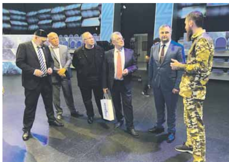
Для представителей Челябинской области провели экскурсию по павильонам и редакциям ЧГТРК Грозный.