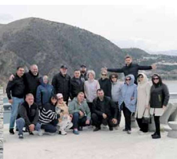
По пути к озеру невозможно проехать мимо древнего поселения Хой, название которого переводится как «Стражник».

По пути к озеру группа останавливалась в селе Харачой у памятника Абреку Зелимхану, где находится родник — девичья коса. Источник течет со склона горы по желобу, образованному из собственных соляных отложений, воду можно пить.