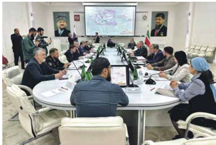
Межрегиональная научно-практическая конференция «80 лет Битве за Кавказ» состоялась в Чеченском государственном педагогическом университете.

Завершилось мероприятие праздничным концертом.