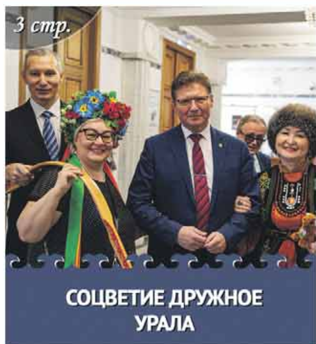
СОЦВЕТИЕ ДРУЖНОЕ УРАЛА