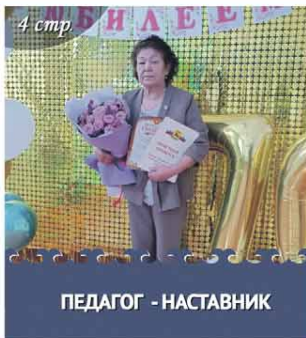
ПЕДАГОГ - НАСТАВНИК