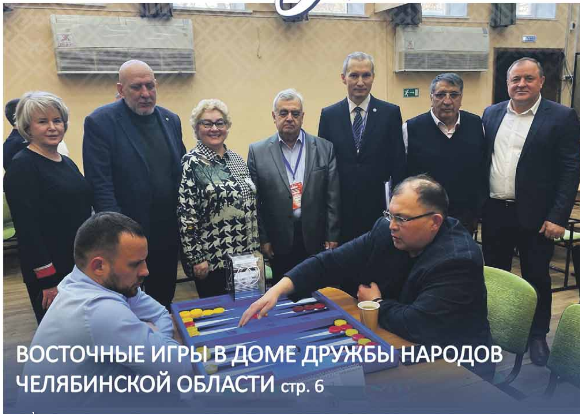
ВОСТОЧНЫЕ ИГРЫ В ДОМЕ ДРУЖБЫ НАРОДОВ ЧЕЛЯБИНСКОЙ ОБЛАСТИ стр. 6