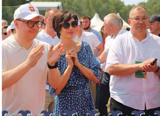
САБАНТУЙ ЧЕЛЯБИНСКОЙ ОБЛАСТИ