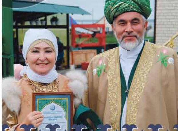
МЕСТО ДЛЯ ДУШИ