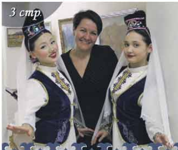
ЗНАКОМСТВО С БАШКИРСКОЙ КУЛЬТУРОЙ