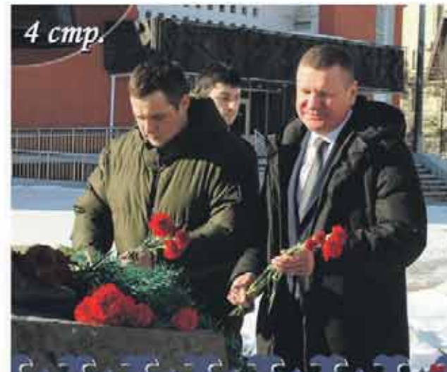
ИСХАК АХМЕРОВ - ЛЕГЕНДА РАЗВЕДКИ