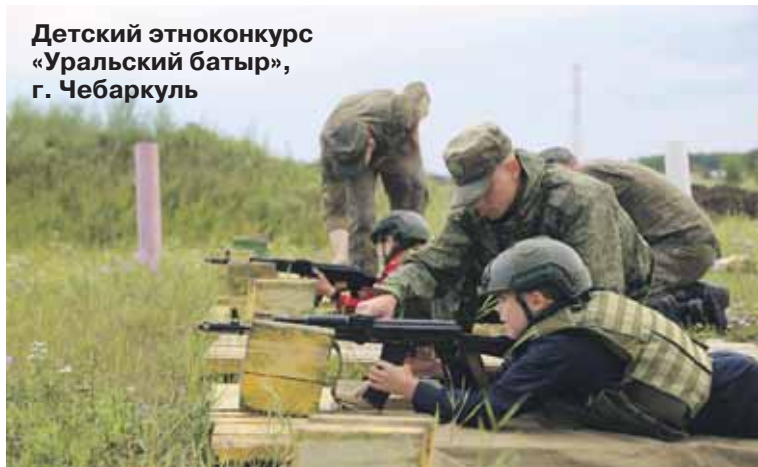
Детский этноконкурс «Уральский батыр», г. Чебаркуль