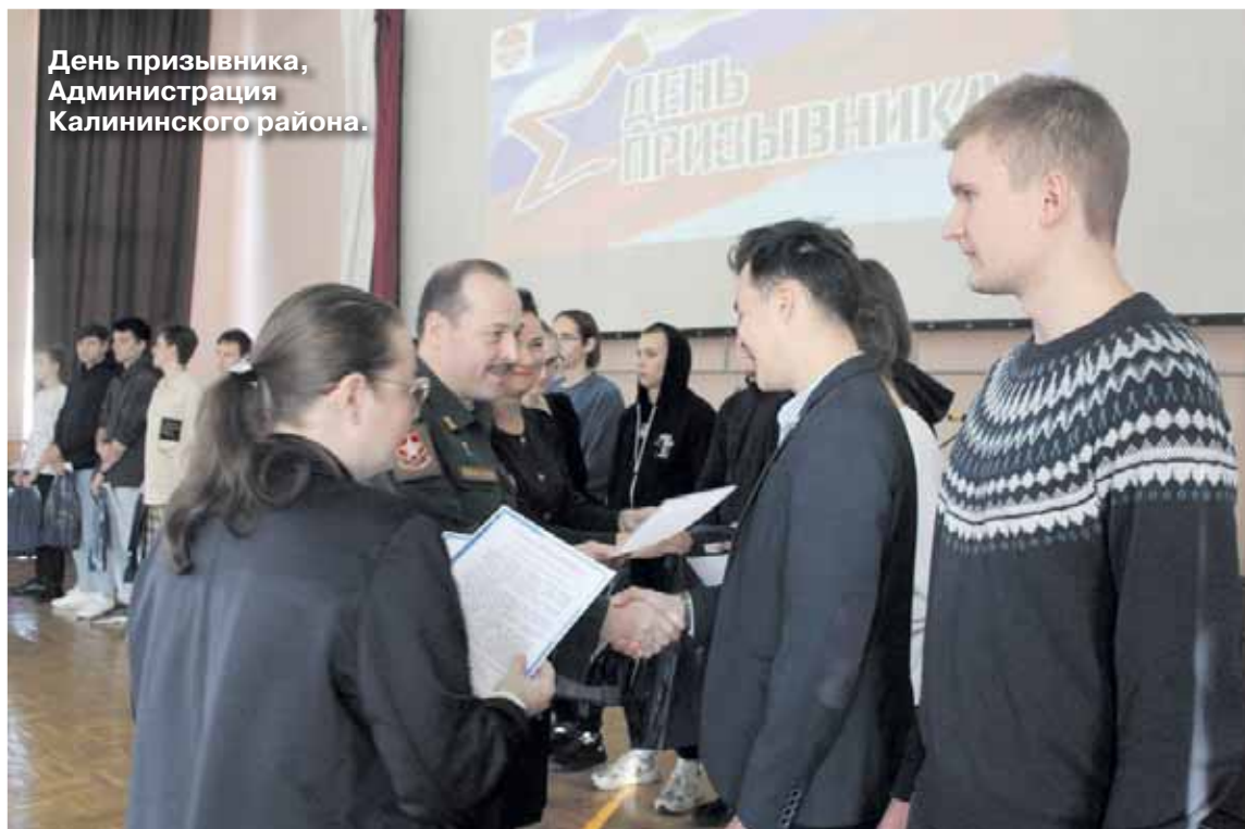
День призывника, Администрация Калининского района.

Это военно-патриотический лагерь (конкурс) для ребят со всей Челябинской области, ребята соревнуются в скорости разборки и сборки автомата Калашникова на специально оборудованном полигоне под чутким присмотром военных. Кроме того, могут почувствовать себя солдатами: надеть шлем, бронежилет и сделать несколько одиночных выстрелов и пострелять очередь настоящими боевыми патронами. Участники конкурса осваивают тренировочные симуляторы, имитирующие работу БМП и танка Т-72, знакомятся с работой наводчика. Обучаются строевой подготовке и в целом знакомятся с бытом военных. Изюминка этноконкурса — это возможность показать себя не только в общепринятых военных дисциплинах, но и в национальных, таких как стрельба из традиционного лука и борьба на поясах корэш. Мероприятия «Уральского батыра» идут практически неделю, юные участники и организаторы живут в казарме, питаются в солдатской столовой.